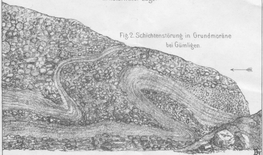
Fig. 2. Schichtenstörung in Grundmoräne bei Gümligen.